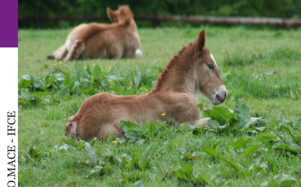
O. MACE - IFCE