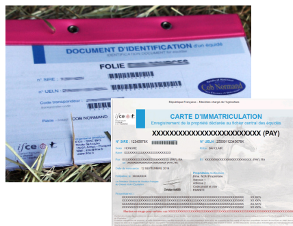
Spécimen de document d'identification et de carte d'immatriculation

Si le dossier ne comporte aucune anomalie, le SIRE édite et envoie les documents du poulain (document d'identification + carte d'immatriculation) dans les 2 mois qui suivent la réception du dernier élément du dossier. Les documents sont envoyés à l'adresse du naisseur (ou premier co-naisseur) inscrit sur la déclaration de naissance, sauf indication contraire de celui-ci.