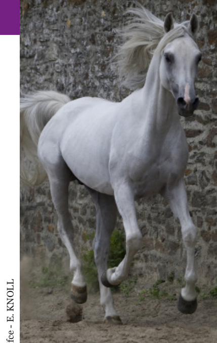
Ifce - E. KNOLL

NB : le certificat sanitaire obligatoire pour l'importation de semence (importation en provenance d'un Pays Tiers ou échange intra européen) doit accompagner les doses jusqu'au lieu de leur utilisation et peut être demandé à tout moment par les services de contrôle des DDPP.