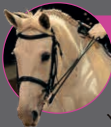
REINETTE DE L'ORNE