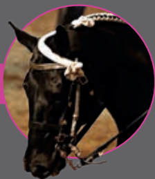
CONNORS DE PRELLE