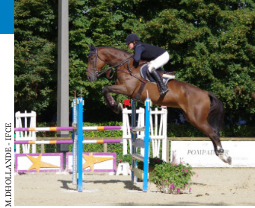
M. DHOLLANDE - IFCE

Vous devrez fournir un signalement avec graphique réalisé par un identificateur (agent Ifce ou vétérinaire identificateur) en plus de l'original du certificat d'origine.