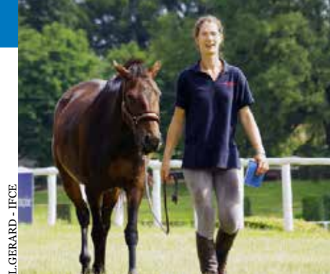
L.GERARD - IFCE

Vous pouvez opter pour un duplicata internet de la carte d'immatriculation tarif réduit.