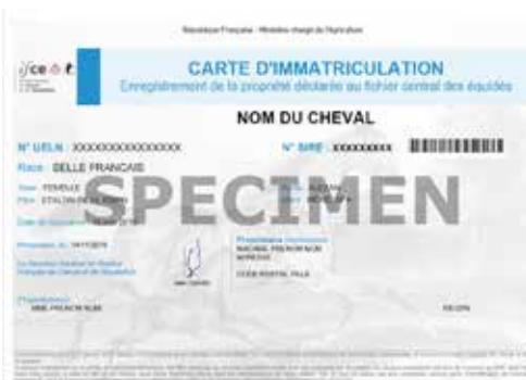
Spécimen de carte d'immatriculation

○ Vous souhaitez changer une carte «internet» en carte «papier» pour un de vos chevaux