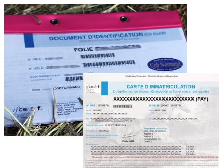
Spécimen de document d'identification et de carte d'immatriculation

Si le dossier ne comporte aucune anomalie, le SIRE édite et envoie les documents du poulain (document d'identification + carte d'immatriculation) dans les 2 mois qui suivent la réception du dernier élément du dossier. Les documents sont envoyés à l'adresse du naisseur (ou premier co-naisseur) inscrit sur la déclaration de naissance, sauf indication contraire de celui-ci.