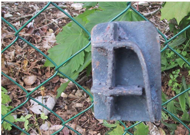
Photographie de la marque