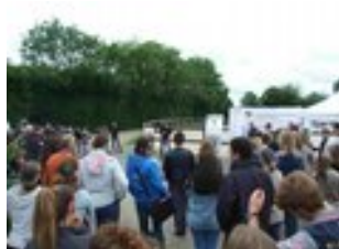
chez Alan Le Gall Domaine de Gauchoux