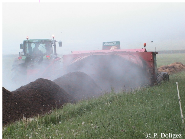
Composteuse ou retourneur d'andain

Nota : Pour porter la mention « biologique » un produit agricole doit respecter les règles spécifiques à la production biologique définies dans l'un des règlements reconnus par la communauté européenne et l'opérateur doit obtenir un certificat valide pour ce produit. Pour cela, chaque opérateur doit s'engager à être contrôlé par un organisme tiers indépendant accrédité selon la norme guide ISO 65, tel qu'ECOCERT.