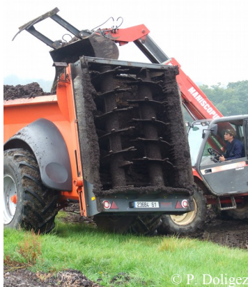
Epandeur à hérisson