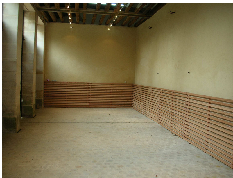
Soubassement bois dans d'une remise a attelage au haras du Pin