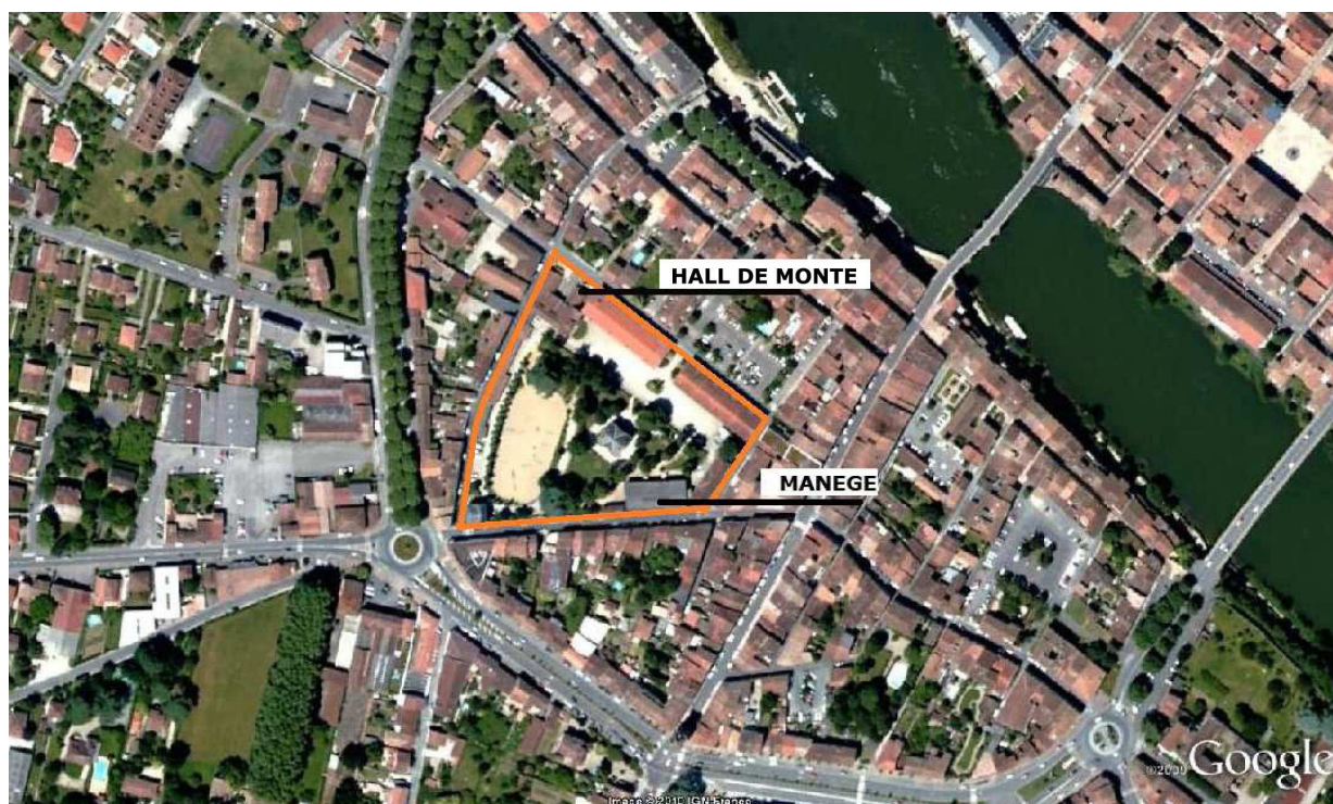
LOCALISATION RAPPROCHÉE (selon GOOGLE EARTH)