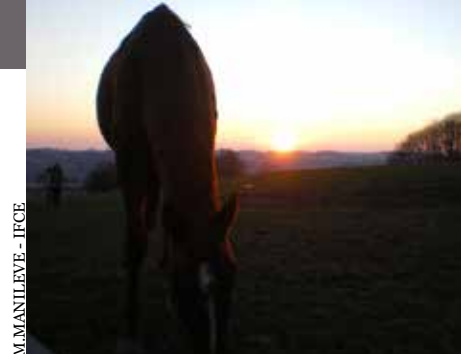
M.MANILEVE - IFCE

Les tarifs sont téléchargeables : Sur le site internet www.ifce.fr rubrique SIRE & Démarches > Fin de vie > Mort d'un équidé & Equarrissage