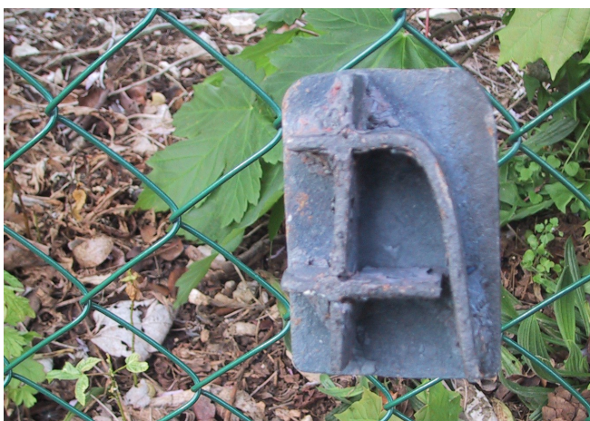
Photographie de la marque